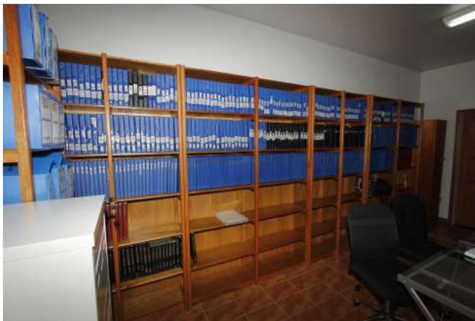
Arquivo do Tabelionato