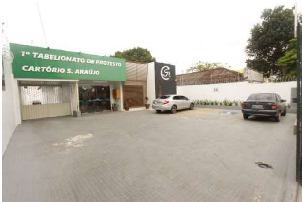
Fachada Principal do Tabelionato