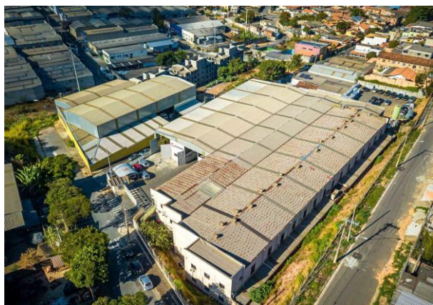
Matriz Industrial GERAFORTE