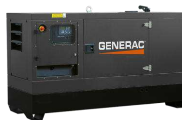
Versão carenada silenciada Imagens ilustrativas