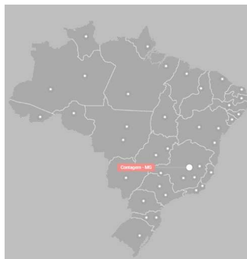
Representações e Escritórios Comerciais no Brasil

A GERAFORTE Grupos Geradores Ltda é fabricante NACIONAL de grupos geradores a diesel e a gás. Projetamos e instalamos soluções em baixa e média tensão de 20 a 10.000 kVA, quadros de comando e força, carenagem acústica e kits atenuadores de ruído.