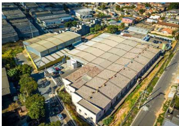
Matriz Industrial GERAFORTE