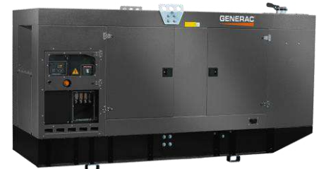
Versão carenada silenciada Imagens ilustrativas