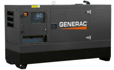
Versão carenada silenciada Imagens ilustrativas