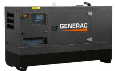
Versão carenada silenciada Imagens ilustrativas