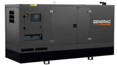
Versão carenada silenciada Imagens ilustrativas