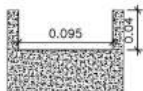
DETALHE CALHA – ESC. 1/1000