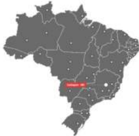
Representações e Escritórios Comerciais no Brasil

A GERAFORTE Grupos Geradores Ltda é fabricante NACIONAL de grupos geradores a diesel e a gás. Projetamos e instalamos soluções em baixa e média tensão de 20 a 10.000 kVA, quadros de comando e força, carenagem acústica e kits atenuadores de ruído.