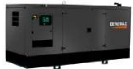
Versão carenada silenciada Imagens ilustrativas