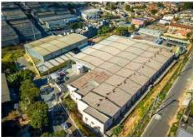
Matriz Industrial GERAFORTE