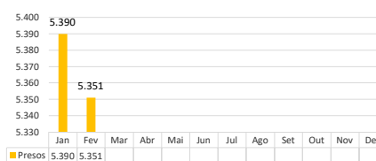
Encarceramento nas Unidade prisionais no estado do Acre em 2025 mês a mês